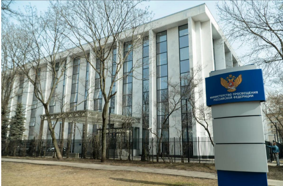
Вид на здание Минпросвещения России со стороны ул. Люсиновской

2. Вход в здание осуществляется через КПП с правой стороны: